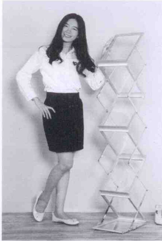
ที่ตั้งแผ่นพับเมื่อใช้งาน