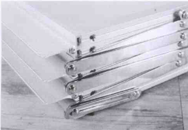
พับเก็บได้