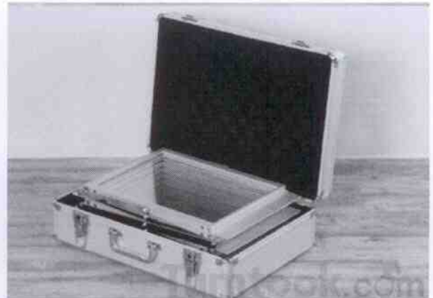
กล่องอะลูมิเนียมสำหรับใส่ที่ตั้งแผ่นพับ