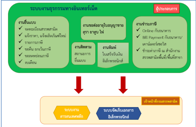
ภาพที่ ๑ แสดงระบบงานธุรกรรมทางอินเทอร์เน็ต

กรมสรรพสามิตมีหน้าที่หลักในการจัดเก็บภาษีสรรพสามิต การให้บริการผู้เสียภาษีเป็นสิ่งสำคัญ กรมจึงเพิ่มช่องทางการชำระภาษีด้วยระบบอิเล็กทรอนิกส์ เพื่อเป็นการอำนวยความสะดวกให้กับผู้เสียภาษีให้สามารถเลือกได้ชำระภาษีสรรพสามิตได้หลายรูปแบบ เช่น การชำระเงินด้วยบัตรเครดิต เครดิต Bill Payment QR Code Internet Banking ชำระเงินผ่าน e-Money และ Smart phone ซึ่งเป็นการพัฒนาการให้บริการไปสู่สังคมไร้เงินสด โดยกรมเปิดให้บริการธุรกรรมทางอินเทอร์เน็ตแก่ผู้ประกอบการอุตสาหกรรม ผู้ประกอบกิจการสถานบริการ ผู้นำเข้า ผู้ส่งออก และประชาชนทั่วไป ซึ่งจะรองรับผู้ประกอบการที่ไม่ใช่แค่คนไทยเท่านั้น แต่รวมไปถึงคนต่างชาติที่ต้องการดำเนินธุรกรรมกับกรมสรรพสามิต โดยผ่านช่องทางอิเล็กทรอนิกส์ ได้แก่ การยื่นแบบคำจดทะเบียนสรรพสามิต การยื่นแบบแจ้งราคาขายปลีกแนะนำ การแจ้งยี่ห้อ แบบ รุ่น สินค้าใหม่ การยื่นแบบรายการภาษี และการชำระภาษี ยื่นแบบคำขอคืนยกเว้น ภาษี การยื่นแบบคำขอลดหย่อนภาษี การยื่นแบบแบบงบเดือนผลิตจำหน่าย การยื่นแบบขอต่ออายุใบอนุญาตขายสุรา ยาสูบ ไร่ และแบบฟอร์มอิเล็กทรอนิกส์ (e-Form) ตามภาพที่ ๑