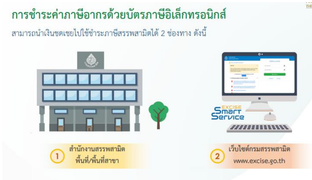
ภาพที่ ๔ แสดงการชำระภาษีด้วยบัตรภาษีอิเล็กทรอนิกส์

โครงการพัฒนาระบบชำระค่าภาษีอากรด้วยบัตรภาษีอิเล็กทรอนิกส์ (Digital Tax Compensation : DTC) เป็นความร่วมมือ ระหว่าง กรมศุลกากร กรมสรรพากร และกรมสรรพสามิต เพื่อพัฒนาระบบชำระค่าภาษีอากรด้วยบัตรภาษีอิเล็กทรอนิกส์ ทำให้ผู้ประกอบการสามารถ ชำระค่าภาษีอากรด้วยวงเงินชดเชยอิเล็กทรอนิกส์ พร้อมกับใบขนสินค้าขาเข้าและใบขนสินค้าขาออก ทำให้สามารถชำระเงินค่าภาษีอากรด้วยบัตรภาษีอิเล็กทรอนิกส์ได้ด้วยตนเองตลอด ๒๔ ชั่วโมง และสามารถยื่นภาษีผ่านระบบเครือข่ายอินเทอร์เน็ตพร้อมกับชำระด้วยบัตรภาษีอิเล็กทรอนิกส์หรือจะมานำบัตรภาษีอิเล็กทรอนิกส์มาชำระภาษีที่สำนักงานสรรพสามิตพื้นที่หรือพื้นที่สาขาได้ โดยจะเริ่มใช้วันที่ ๒๑ กันยายน ๒๕๖๔ เป็นต้นไป